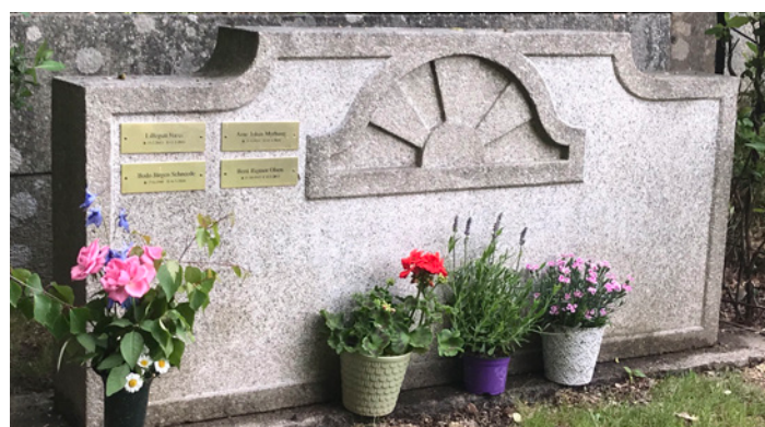
Ved den navnete minnelunden på Os, rett ved kapellet, kan man sette blomster og lys på sokkelen til monumentet.

– I tillegg til den anonyme minnelunden ved Asak kirke, har vi ved Os en navnet minnelund hvor det kan settes ned askeurner. Monumentet er av Iddefjordsgranitt og utstyrt med navneskilt på den enkelte som er gravlagt der.