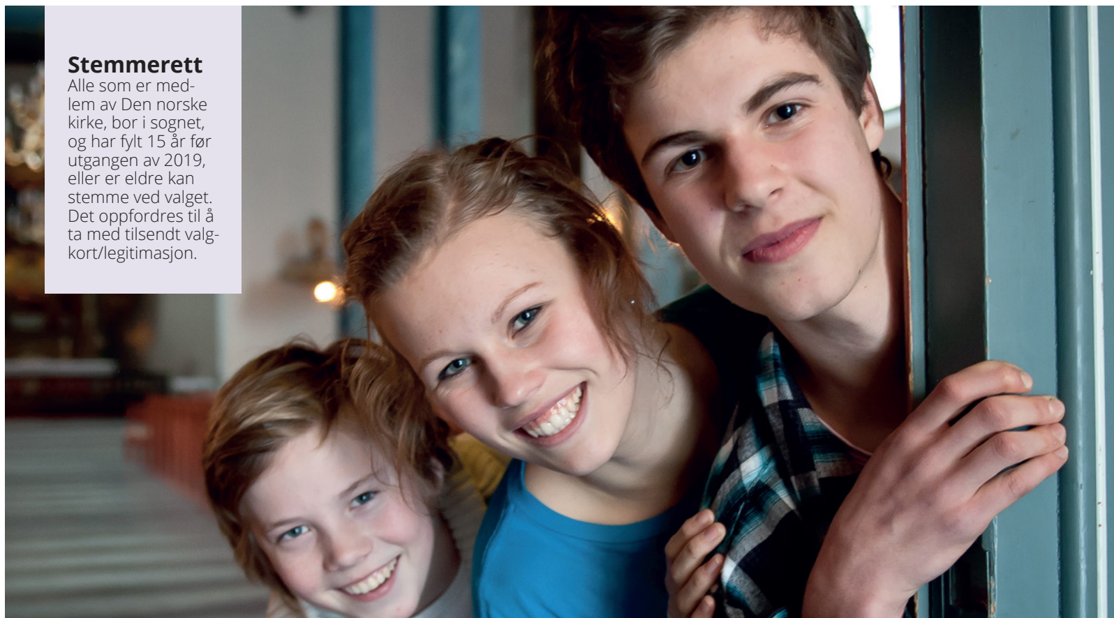
Alle medlemmer av Den norske kirke har stemmerett i Kirkevalget fra det året de fyller 15.

Det nærmer seg kommune, fylkestingsvalg og kirkevalg. Kirkevalget består av valg på menighetsråd i din lokale menighet. I tillegg omfatter også kirkevalget valg på leke medlemmer til Borg bispedømmeråd/Kirkemøtet.